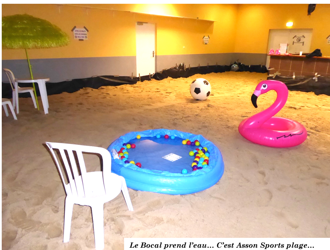
Le Bocal prend l'eau... C'est Asson Sports plage...