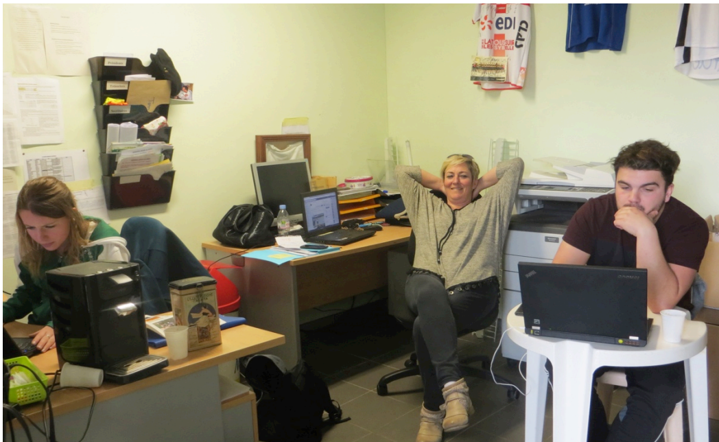
Des jeunes contractuels sous le regard bienveillant de la maîtresse de stage...