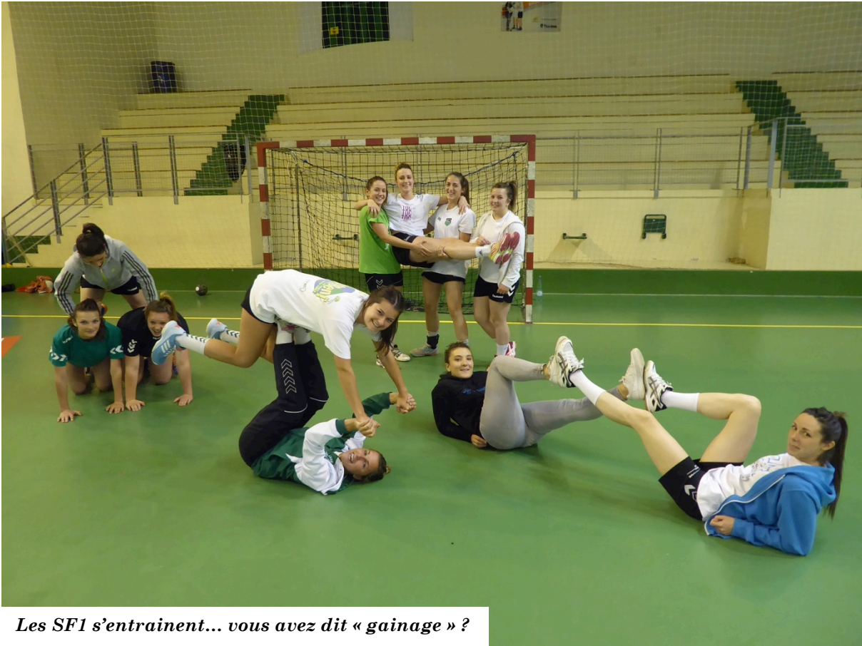
Les SF1 s'entraînent... vous avez dit « gainage » ?