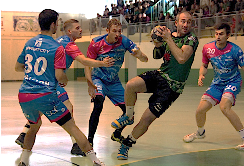
Coupe de France Dimanche 12 novembre 2018 Asson (N2) – Billère (N1)